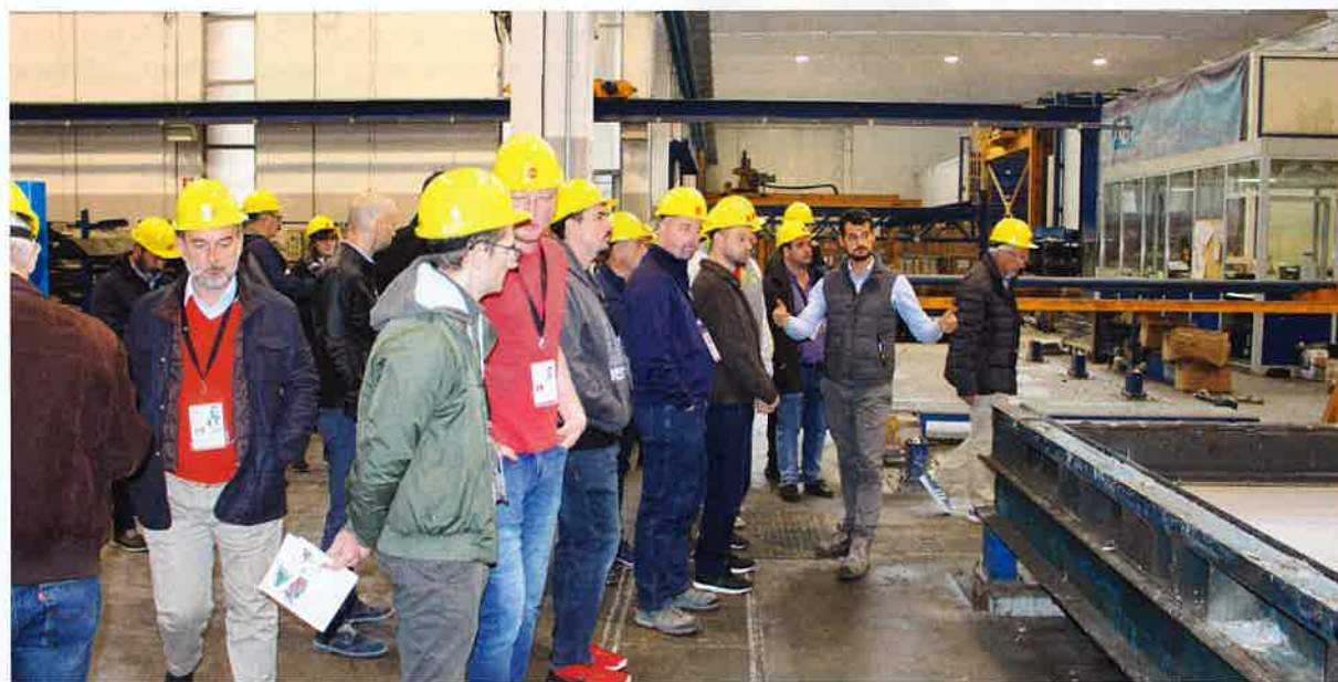
Figure: BFT International

Die Technical Mission to Italy 2018 machte unter anderem Station bei MC Prefabbricati im norditalienischen Bellinzago Novarese